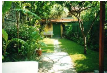
Garten mit Gartenhäuschen

steht in einer privaten Tiefgarage gleich hinter der Post, ca. 5 Fußminuten.