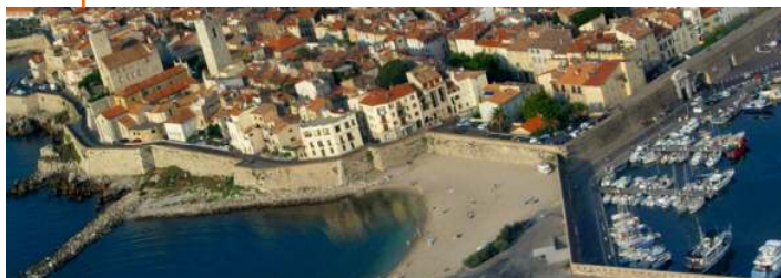
Blick von der Marina, die Gravette

Das Meer ist ungefähr 250 Meter Luftlinie entfernt. Der nächste Strand hinter dem Fischerhafen, in einer herrlichen, geschützten Bucht mit Blick auf die Remparts - dort werden oft Fotos von neu auf den Markt ge-