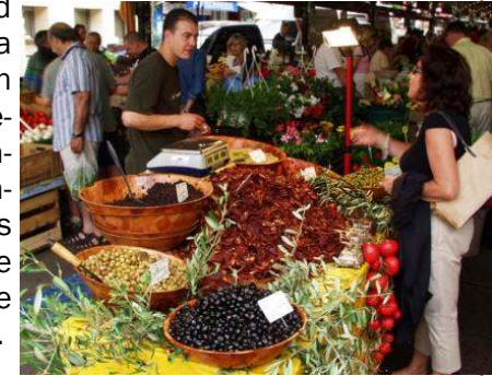
Typischer Stand am Marché Couvert

Für den täglichen Bedarf, wie Bäcker, Metzger, Traiteur, Hühnerbrater, Austernmensch, Fischer und Tante Emma Laden sind in diesem Bereich ebenfalls vorhanden, alles ganz echte Typen, wie aus dem Film.