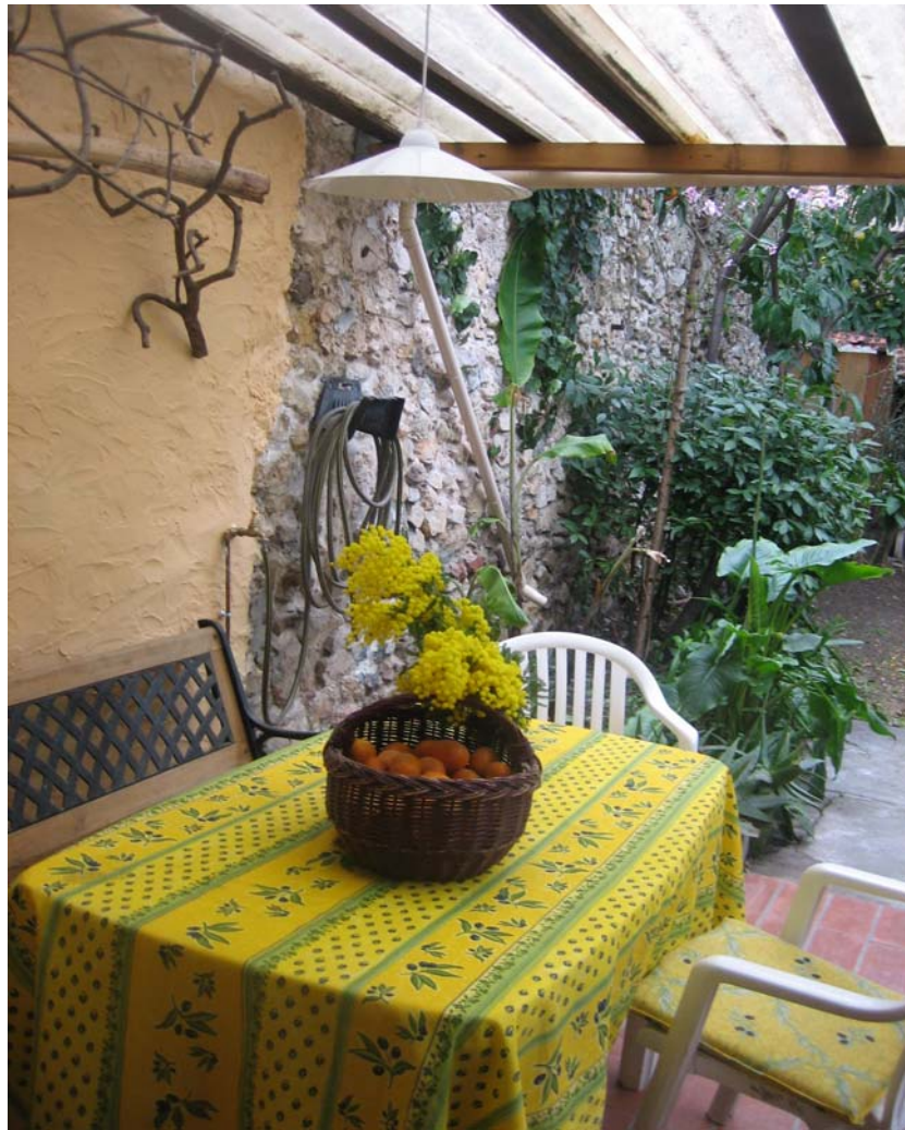
der Sitzplatz auf der Terrasse