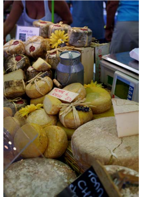
auf dem Markt Marchè Provençal